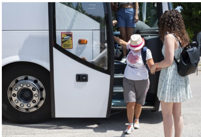
Viaggio in pullman durante i Soggiorni Estivi

← segue da pagina 1 | il treno da sola per recarsi a Lecco, dalla sorella. Uscire di casa, però, ha le sue difficoltà: «I paletti, le moto e i monopattini parcheggiati sui marciapiedi, i tombini non a livello della strada sono tutti ostacoli per me che utilizzo il bastone bianco e rosso. E i semafori non sempre hanno il segnale acustico», racconta. «In metropolitana, poi, non tutte le stazioni sono pensate per chi ha difficoltà visive: alcune sono poco illuminate, a volte gli ascensori non funzionano, non sempre viene annunciato quale treno sta arrivando. Mi è capitato persino di imbartermi in percorsi pedotattili che finiscono nel nulla!». Qualcosa sta cambiando: «In alcune stazioni ferroviarie ci sono le "Sale Blu", punti di accoglienza dove qualcuno ti accompagna fino al treno: però vanno prenotate almeno 48 ore prima del viaggio».