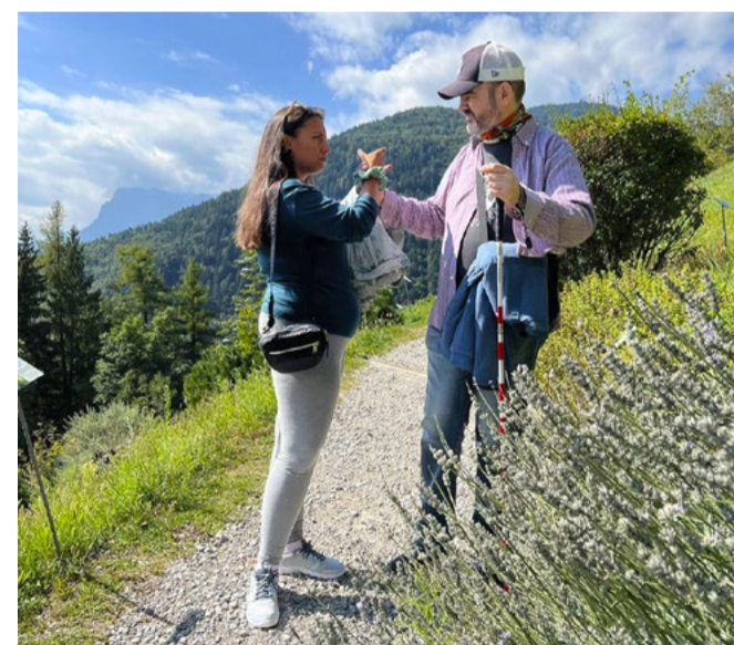
In cammino sui sentieri di montagna