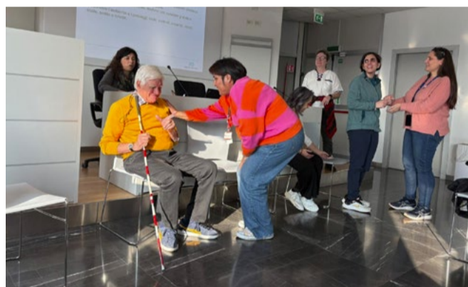
Formazione su come accompagnare una persona sordocieca